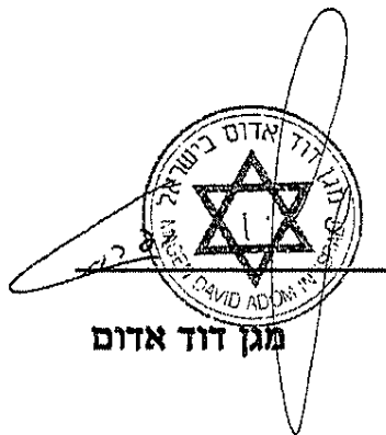
מגן דוד אדום

אגודת מגן דוד אדום תעביר דוח שנתי המרכז את פעילות בקורות אגף הרפואה של מד"א, הדוח יכלול מועד הבקרה, סוג הבקרה, ממצאי הבקרה/פירוט ליקויים ותיקון ליקויים. ללא מידע אישי.